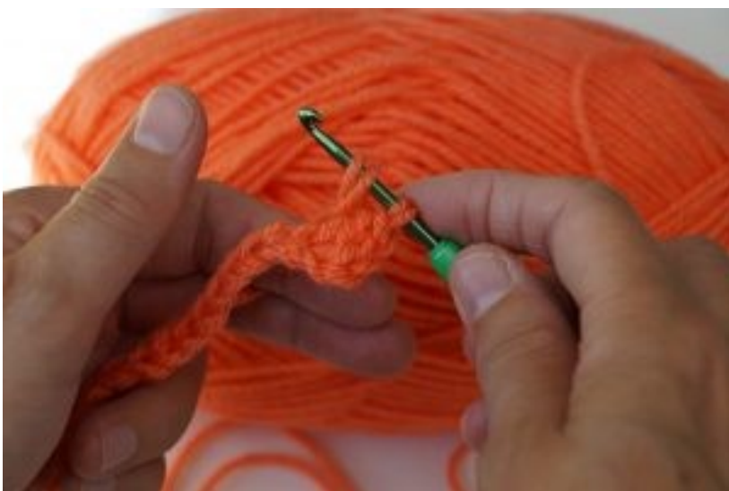
Bijchrift bij foto of afbeelding